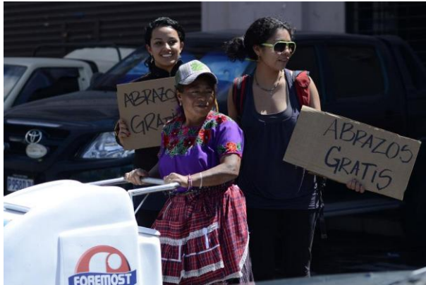
Diciembre 2012. Xela, Guatemala. Actividades de Difusión Bancos del Tiempo