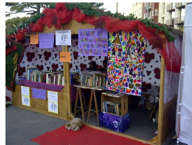
Diciembre 2012 - Sagunto. Campaña Libros Solidarios