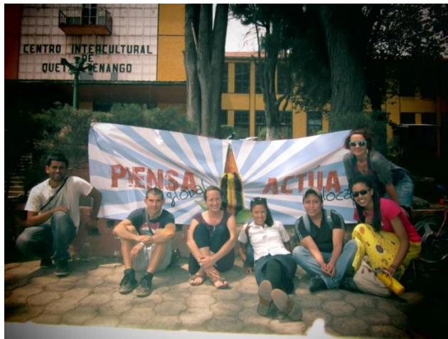
Noviembre 2012. Campaña Piensa Global Actúa Local Xela

La Asociación PANKARA ECOGLOBAL junto con la PLATAFORMA DE ASOCIACIONES PARA EL DESARROLLO LOCAL, de Quetzaltenango, con motivo del día internacional de la lucha contra las grandes superficies que se celebra el día 17 de noviembre, se reúnen los días 17 de cada mes. Con ello se pretende la concienciación, sensibilización, educación para el desarrollo e incidencia política en pro de la Soberanía Alimentaria de las comunidades.