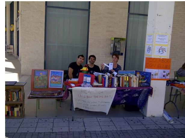
Bienvenida Universidad Jaime Septiembre 2012. Campaña Libros Solidarios

Con esta campaña recaudamos fondos para proyectos de Cooperación al Desarrollo, con un doble fin, obtener libros a cambio de la voluntad y a la vez recoger los libros donados, que servirán para recaudar fondos en próximas acciones. Esta actividad ya la llevamos a cabo en la Universidad Jaime I de Castellón (UJI) en la semana de Bienvenida en octubre del 2012. A raíz de la buena acogida de esta iniciativa en la UJI, desde PANKARA EcoGlobal hemos continuado con esta campaña en diferentes ferias como la Feria de Navidad de Sagunto y Puerto de Sagunto.