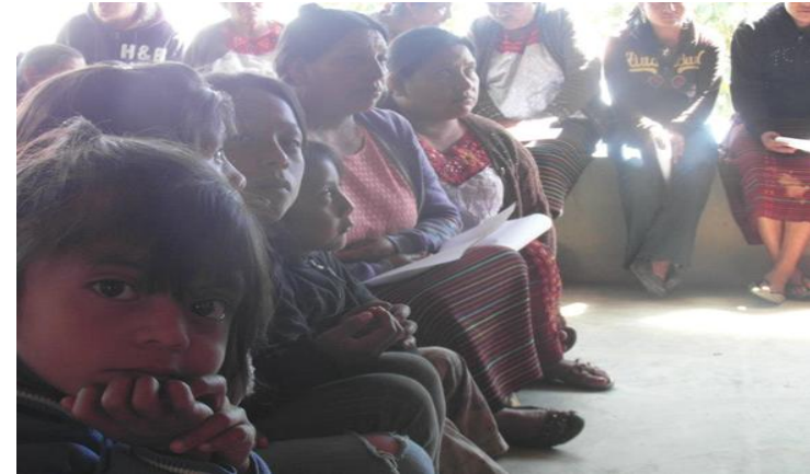
Noviembre 2012. Xela, Guatemala. Taller Capacitación Conservación Alimentos

3.- Capacitación de colectivos de mujeres para la conservación de alimentos en la comunidad Ojos de Agua, municipio de Aguacatán, departamento de Huhuetenango. Con este proyecto se pretende mejorar las condiciones de vida de las familias productoras minifundistas a través de la adquisición de conocimientos y materiales para la confección de artesanías, productos ecológicos y conservas de alimentos, mediante la impartición de talleres de procedimientos de conservación de alimentos, tanto de origen cárnico como vegetal, con el fin de asegurar la Seguridad Alimentaria y aumentar el nivel de ingresos de las familias beneficiarias al poder vender las conservas excedentes.