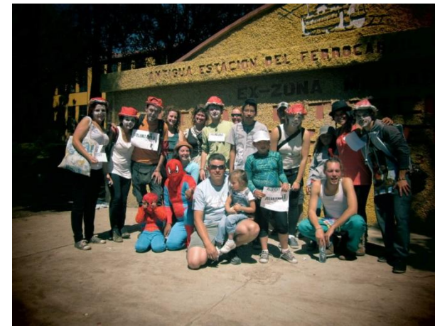
Diciembre 2012. Xela, Guatemala. Actividades de Difusión Bancos del Tiempo

capacidades entre los/as integrantes del Banco del Tiempo. Se pretende, replicar el desarrollo de este proyecto, a todo el territorio de Guatemala.