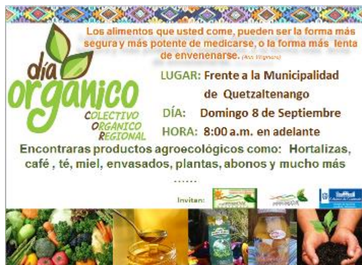
Septiembre 2013. Campaña Piensa Global Actúa Local Xela.