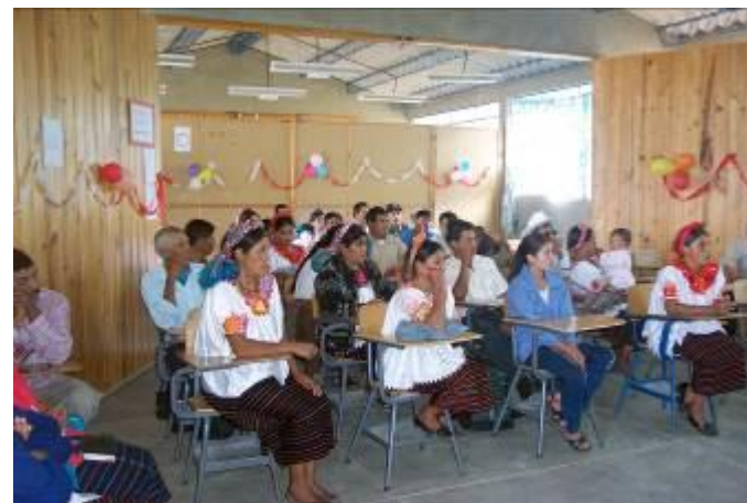
Diciembre 2013. Xela, Guatemala. Taller Capacitación procesado alimentos