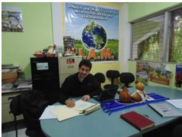
(Arriba) Firma de los certificados del Diplomado.