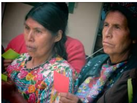
Febrero 2013. Xela, Guatemala. Taller Capacitación tintado de hilos

leche procedente de la cría de animales (cabras y ovejas), mediante la práctica del “pase de cadena”.