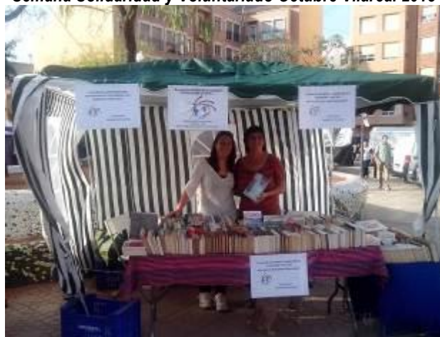
Feria Alternativa Onda (Castellón) Octubre 2013