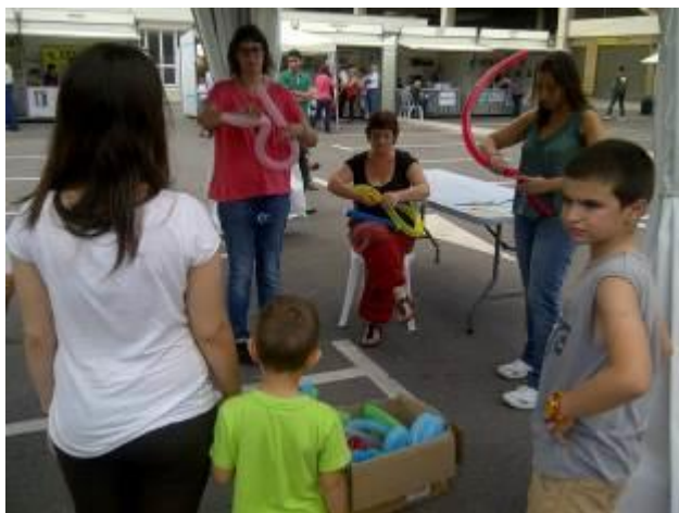
Taller Globoflexia Asoc. Pankara EcoGlobal Semana Solidaridad y Voluntariado Octubre Vilareal 2013