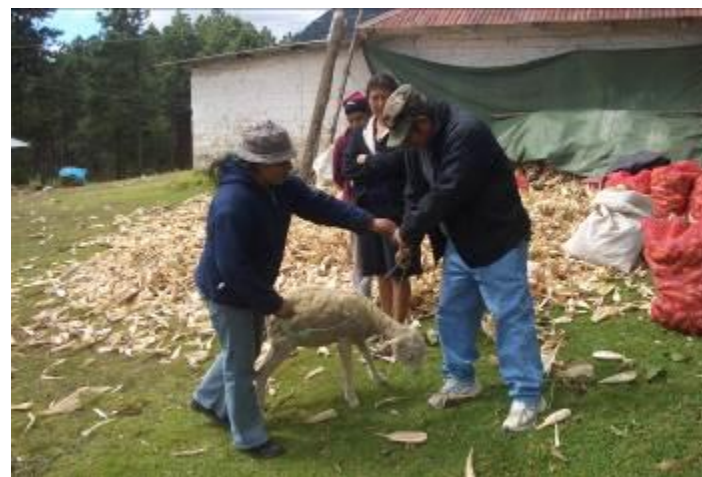
Pase de cadena en las Comunidades de California y Shalanshac (abajo)