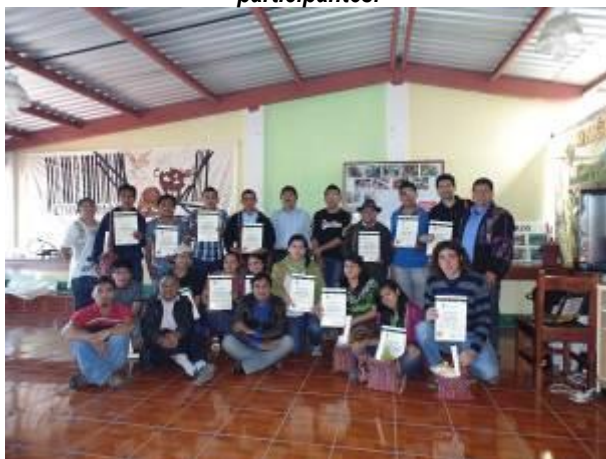
(Abajo) Participación en el acto de clausura y entrega de diplomas a los participantes.