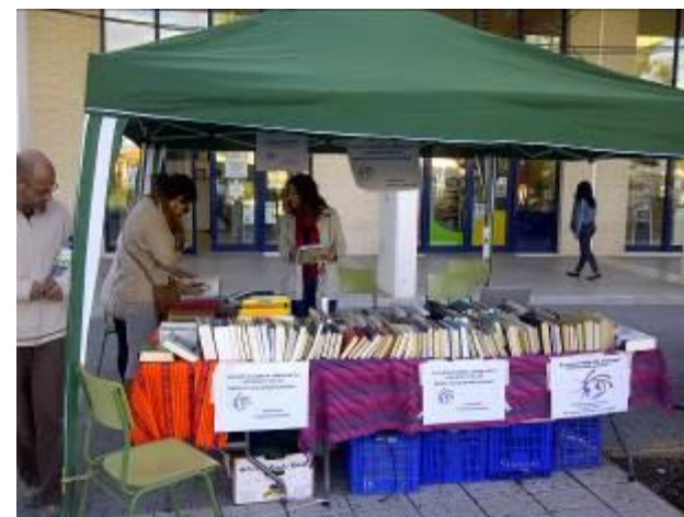
Semana Bienvenida Universidad Jaume I Noviembre 2013