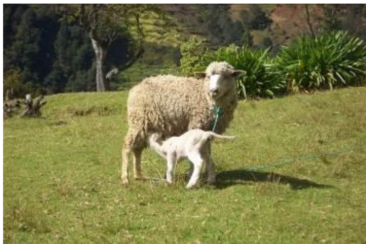
Oveja en edad de madurez y cría

La Asociación PANKARA EcoGlobal junto con ADICTA, durante el mes de diciembre, participa y está presente en dos pases de cadena (10/12/2013), consistente en la entrega de dos crías de ovejas criollas sanas y en edad de madurez, a dos familias beneficiarias en las comunidades de California y Shalanshac de Tejutla, en el departamento de San Marcos, fomentado así la difusión de la “tecnología de pase de cadena”, así como la cooperación y transmisión de valores éticos y solidarios entre las comunidades rurales, en pro de una soberanía alimentaria.