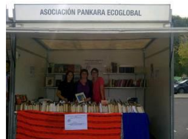
Semana Solidaridad y Voluntariado Octubre Vilareal 2013