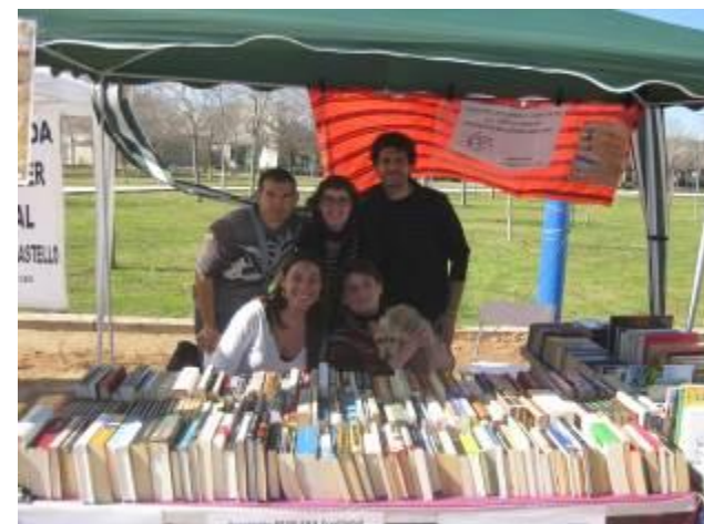
Feria Alternativa Castellón Marzo 2013

Con esta campaña se recaudaron fondos para proyectos de Cooperación al Desarrollo, con un doble fin, por un lado obtener libros a cambio de la voluntad, y por otro recoger los libros donados, que sirvan para recaudar fondos en próximas acciones. Esta actividad ya iniciada en el 2012, se ha continuado durante el año 2013, no sólo en la Universidad Jaime I, donde tuvo una gran acogida sino también en diferentes ferias alternativas realizadas en diferentes localidades de la provincia de Castellón.