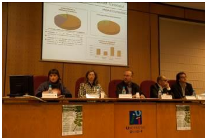
Presentación del Seminario.