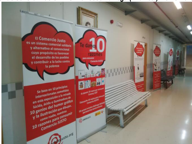
Exposición de Comercio Justo durante los talleres de sensibilización en I.E.S de Vila-real (Exposición de la Coordinadora Estatal de Comercio Justo cedida por la Tenda de Tot el Mon.( Sagunto)