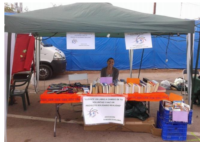
Participación Festival Rototom (Benicasim) Agosto 2014