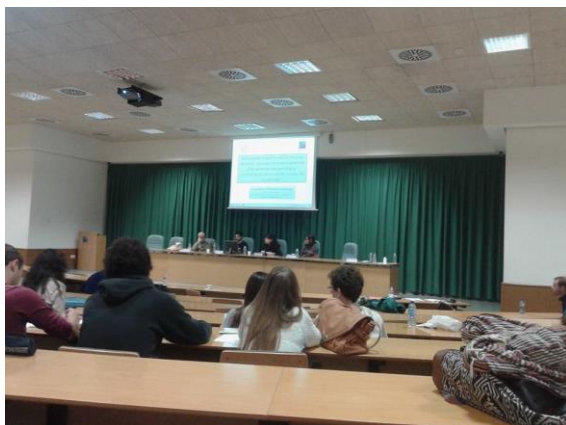
Ponencia XVIII Jornadas de Cooperación Internacional y Solidaridad Universitat Jaume I (Castellón) Noviembre 2014