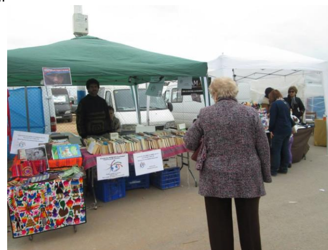
Feria Alternativa Fiestas de la Magdalena (Castellón) Marzo 2014

Con esta campaña se recaudaron fondos para proyectos de Cooperación al Desarrollo, con un doble fin, por un lado obtener libros a cambio de la voluntad, y por otro recoger los libros donados, que sirvan para recaudar fondos en próximas acciones. Esta actividad ya iniciada en el 2012, se ha continuado durante los años 2013 y 2014, no sólo en la Universidad Jaime I, donde tuvo una gran acogida sino también en diferentes ferias alternativas realizadas en diferentes localidades de la provincia de Castellón.