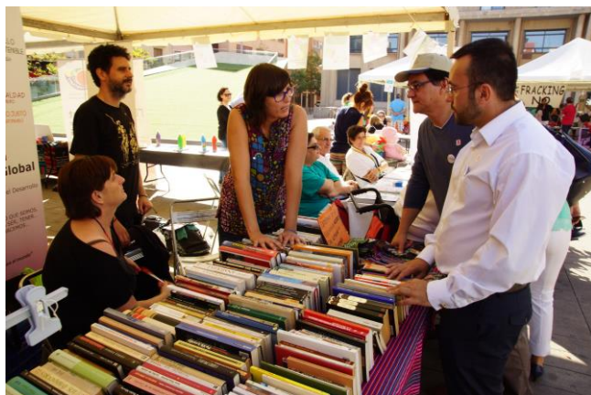
Feria Solidaridad y Voluntariado (Vila-real) Octubre 2014