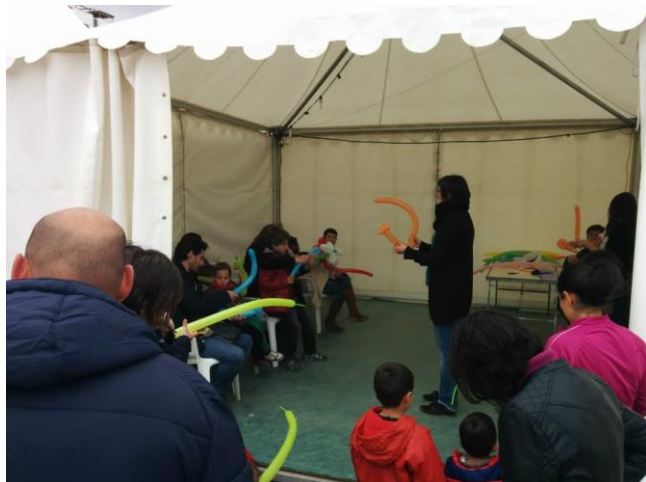
Feria Alternativa Fiestas de la Magdalena (Castellón) taller de globoflexia Marzo 2014