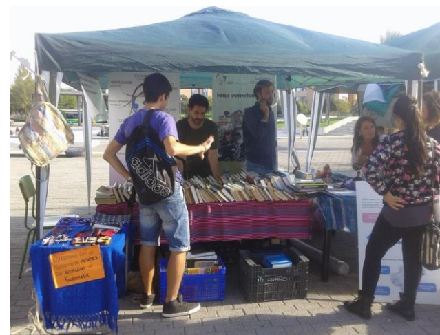
Semana Bienvenida Universidad Jaime I Noviembre 2013