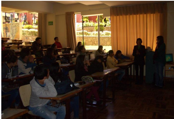
Seminario "Cooperación al Desarrollo y gestión de entidades no lucrativas" " Universidad Andina del Cusco (Perú) Julio 2014