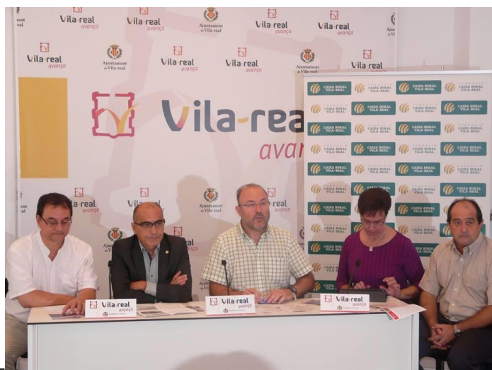
Presentación curso “Sostenibilidad y agricultura ecológica”. Vila-real, Octubre 2014

Rueda de prensa en el Ayuntamiento de Vila-real para presentar el curso de formación Continuada “Sostenibilidad y agricultura ecológica” de la Universitat Jaume I de Castellón en el que participa la Asociación PANKARA EcoGlobal como entidad organizadora.