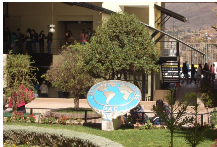
Universidad Andina del Cusco (Perú) Julio 2014