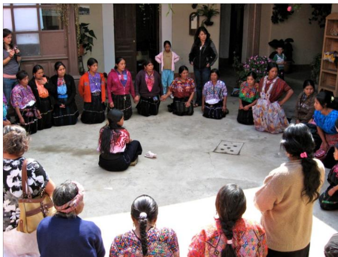
Xela, Guatemala. Taller Capacitación tintado de hilos