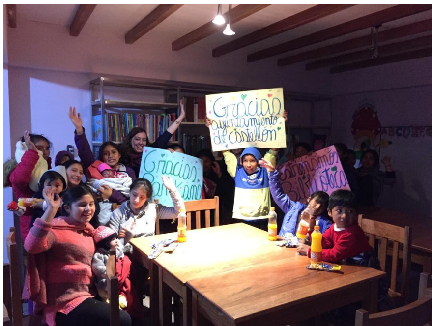
Casa Mantay. Cusco, Perú.

Fecha finalización Proyecto: 21 de diciembre del 2018