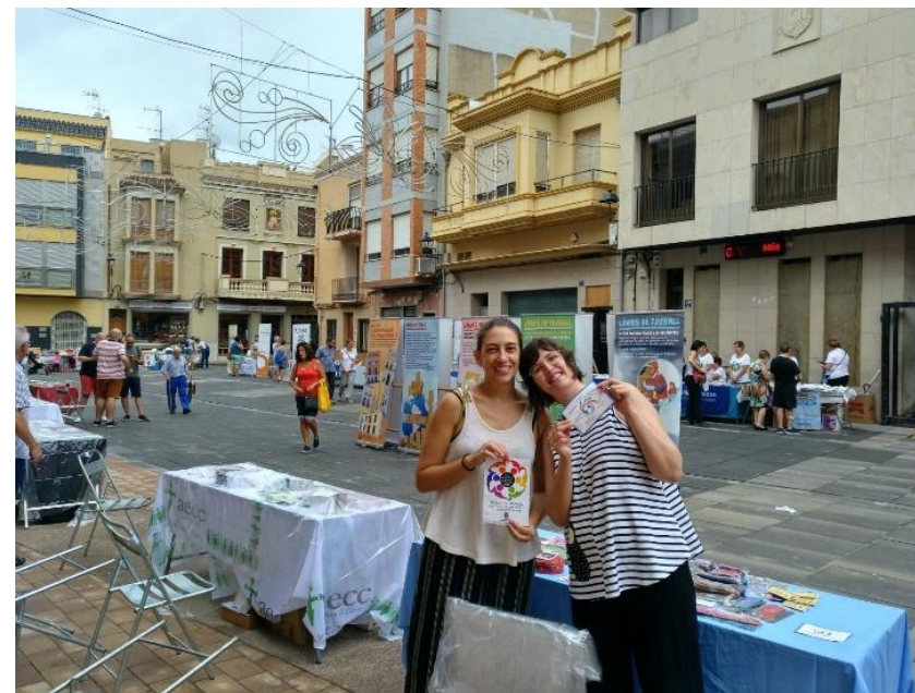
II Feria Solidaridad, Cooperación y Voluntariado (Betxi). Septiembre 2018