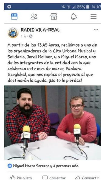
Cita Urbana Solidaria Marzo 2018. Vila-real