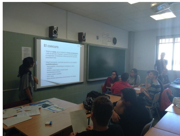
Taller de sensibilización en Institutos del Municipio de Vila-real

Unas de estas actividades fue dirigida a los más jóvenes a través de talleres de sensibilización sobre el "Los barrancos y las ramblas" realizados entre estudiantes de 4º de la ESO en institutos del Municipio de Vila-real y que sirvió para preparar a los alumnos y explicarles la importancia de la buena gestión de estos espacios, y al mismo tiempo para explicar las bases de cara a la participación en el "concurso ciudad de Vila-real hacia el desarrollo sostenible", dirigido a los y las estudiantes de 4º de ESO y que en esta edición la temática era "los barrancos de Vila-real".