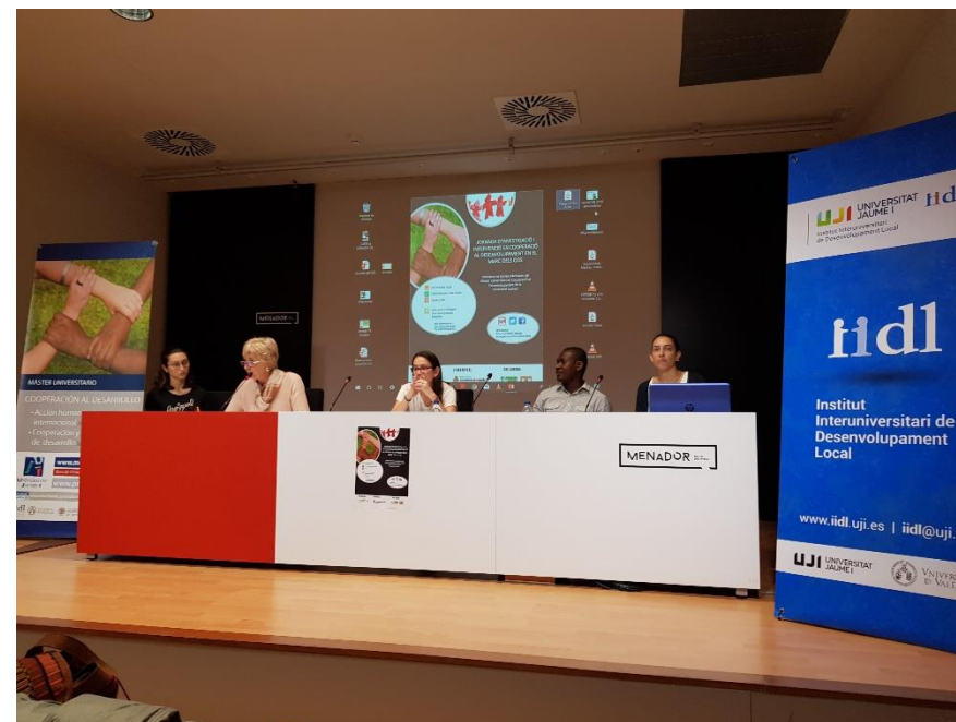
Participación mesa redonda Jornada UJI/Ayuntamiento de Castellón. Octubre 2018