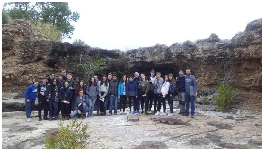
Visita Barrancos centros IES Broch i Llop y Sta. María Vila-real

Visita de los alumnos y las alumnas participantes de 4º ESO de los centros IES Broch i Llop y Sta. Maria en el concurso Ciudad de Vila-real hacia el desarrollo sostenible al barranco de Ràtils, el barranco de l'Espaser, la confluencia de los barrancos Roig con Ràtils y el salt de Betxí