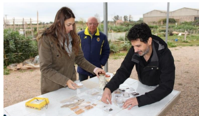
Semillas de variedades de hortalizas del banco de semillas

Por estos motivos las variedades locales son más rústicas, permiten obtener mayores rendimientos, a la vez que proporcionan un sello de identidad a la agricultura de la zona, por eso es importante utilizarlas en nuestros huertos ecológicos y sostenibles.