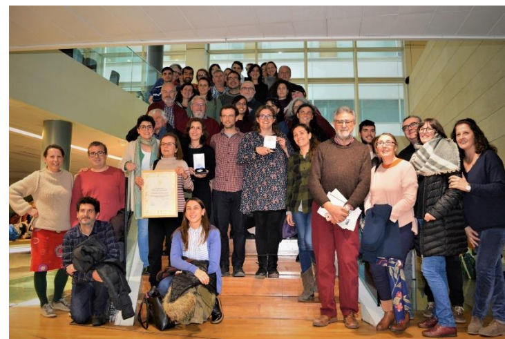
Junta ordinaria CVONG 2018