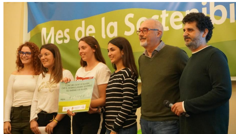
Entrega del Premio Mes Sostenibilidad Vila-real. 2018

El premio a la mejor propuesta se entregó al Instituto ganador en La Gala del Mes de la Sostenibilidad en octubre de 2018.