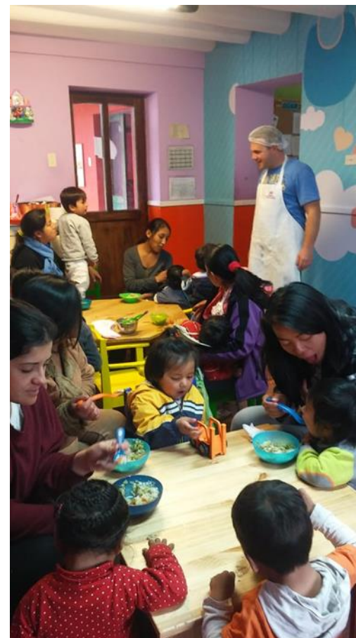
Casa Mantay. Cusco, Perú.