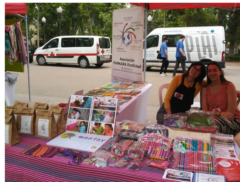
Fiesta de la Cooperación internacional y el Comercio celebrada Parque Ribalta (Castellón) Mayo 2018.