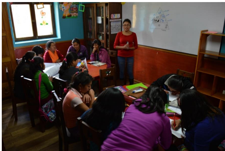
Casa Mantay. Cusco, Perú.

Fecha finalización Proyecto: 1 de noviembre del 2018