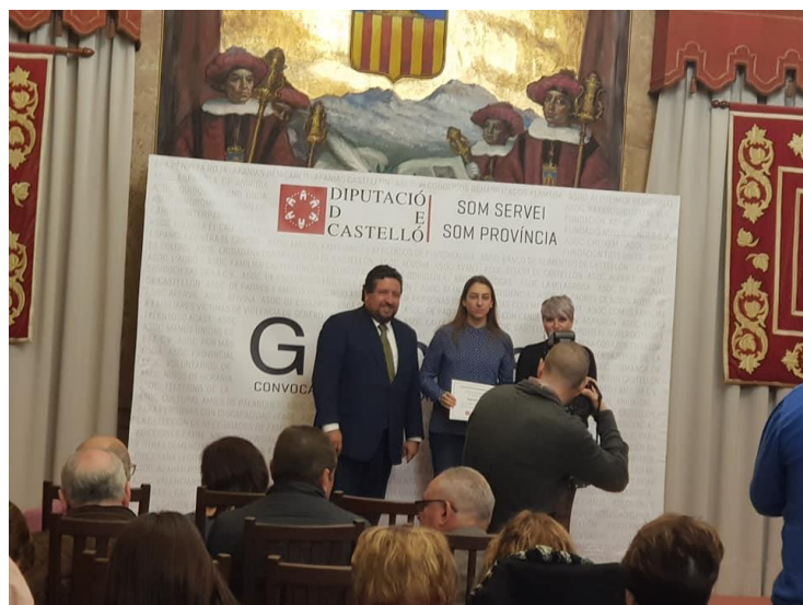
Acto de entrega de premio Diputación de Castellón 2018

Entrega de reconocimientos de la Diputación de Castellón a las entidades beneficiarias de ayudas sociales 2018. Pankara ha recibido el reconocimiento por el proyecto presentado en Peru con Casa Mantay a la convocatoria de proyectos de cooperación al desarrollo.