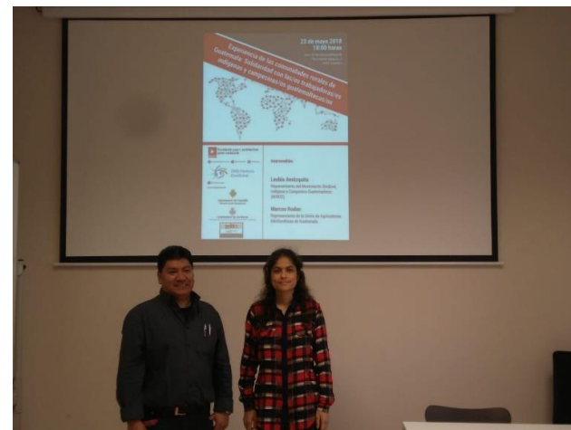
Ponentes Conferencia Guatemala (Castellón) Mayo 2018.