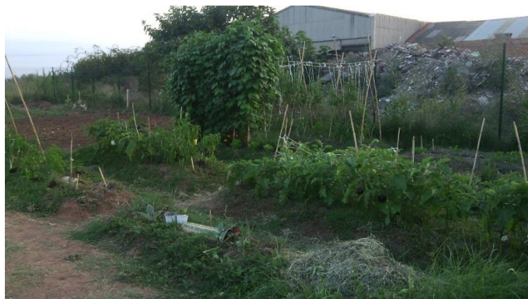
Parcela en los huertos urbanos de Vila-real