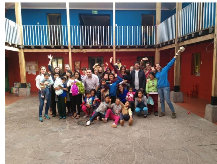
Casa Mantay. Cusco, Perú.