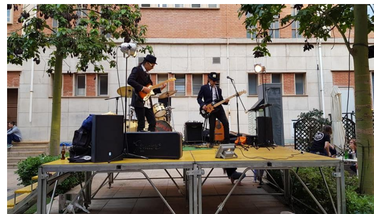
Cita Urbana Solidaria Mayo 2019. Vila-real