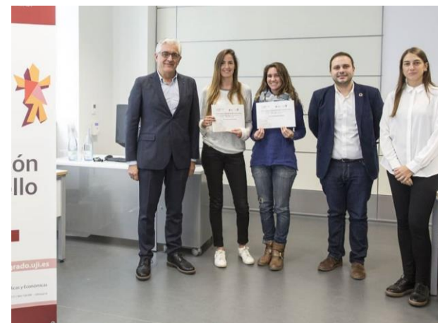
Participación Clausura y entrega premio Jornada UJI/Ayuntamiento de Castellón. Noviembre 2019

Participación como representante de la CVONGD en la clausura y entrega de premio de investigación de TFM en la jornada organizada por el Máster de Cooperación al Desarrollo de la Universitat Jaume I junto con el Ayuntamiento de Castelló, en la Jornada de Investigación e Intervención en Cooperación al Desarrollo en el marco de los ODS: Intercambio de buenas prácticas del Máster Universitario en Cooperación al Desarrollo de la Universitat Jaume I que se celebró el 15 de noviembre de 2019.