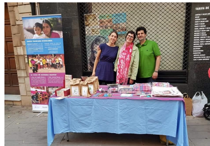
Cita Urbana Solidaria Mayo 2019. Vila-real

Participación en conciertos de música en la Cita Urbana Solidaria de Vila-real en mayo del 2019, se recaudaron fondos para proyectos de Cooperación al Desarrollo, a través de la venta de artesanía elaborada por las madres adolescentes residentes en la Casa Mantay en Cusco. Perú.