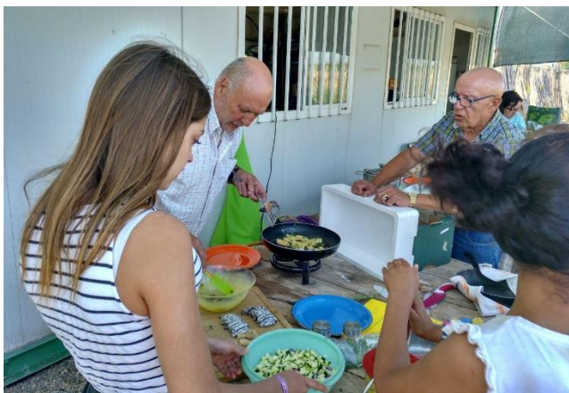
Taller cocina saludable y sostenible huertos urbanos de Vila-real. Junio 2019