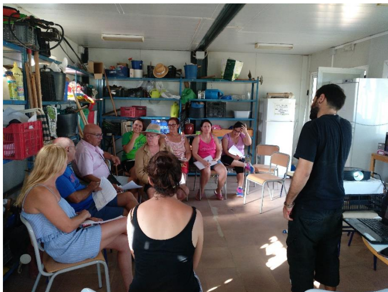
Taller extracción y conservación de semillas. Junio 2019