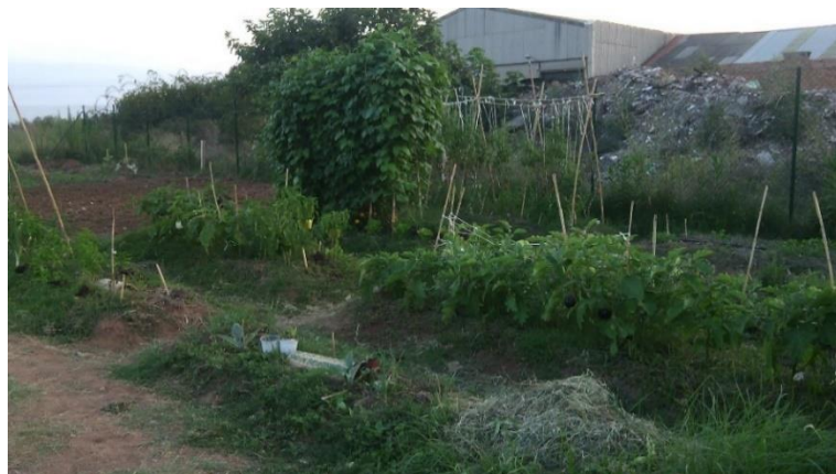
Parcela en los huertos urbanos de Vila-real