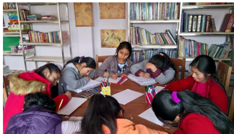
Proyecto Asociación Qallariy. Casa Mantay (Perú)