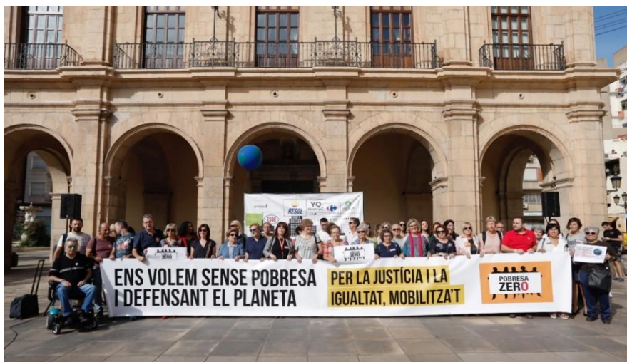
Lectura de Manifiesto por el Día de Pobreza Zero. Octubre 2019

Se hizo una performance para hacer ver a la ciudadanía la importancia del cuidado al planeta y como esto influye en la pobreza en el mundo. A continuación se hizo la lectura de un manifiesto y concentración en la plaza Mayor de Castellón.