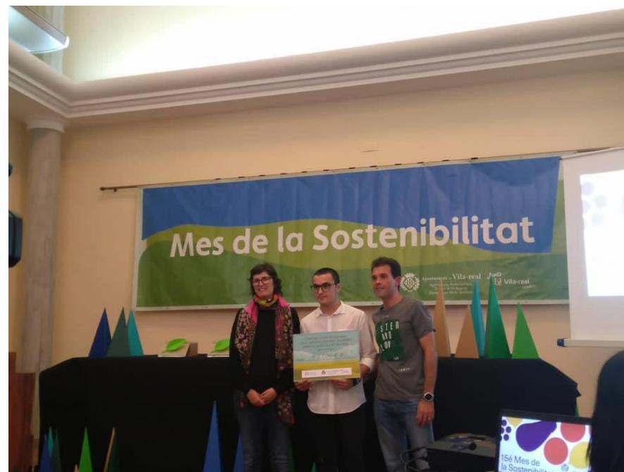
Entrega del Premio Mes Sostenibilidad Vila-real. 2019

El premio a la mejor propuesta se entregó al Instituto ganador en La Gala del Mes de la Sostenibilidad en octubre de 2019.