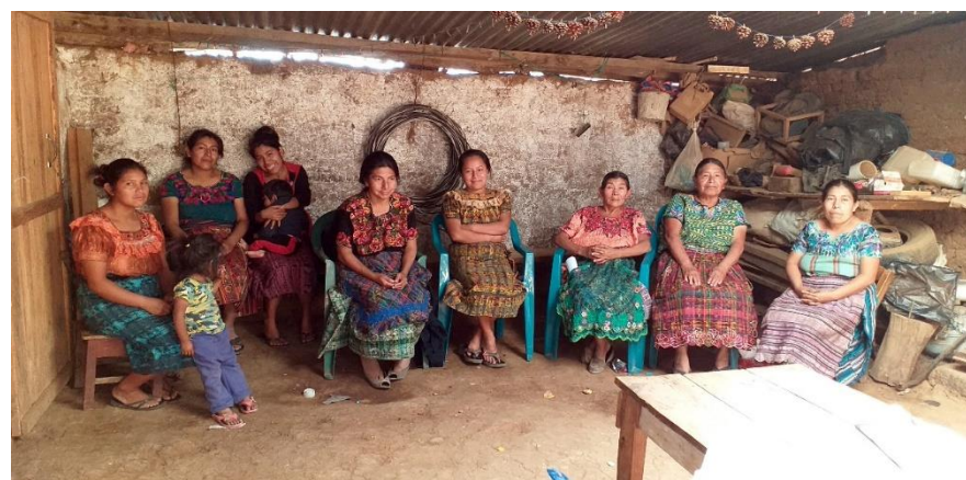
Proyecto Unión de Agricultores Minifundistas UAM (Perú)