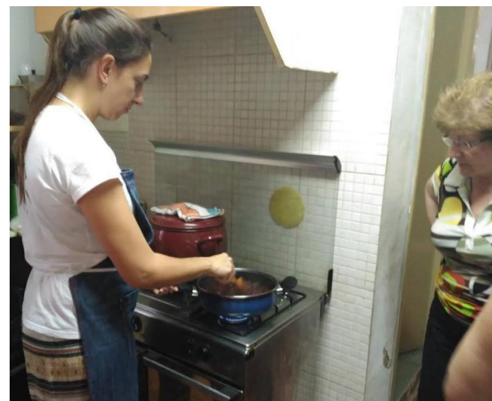
Taller ODS3: Producción y consumo responsable. Julio 2019