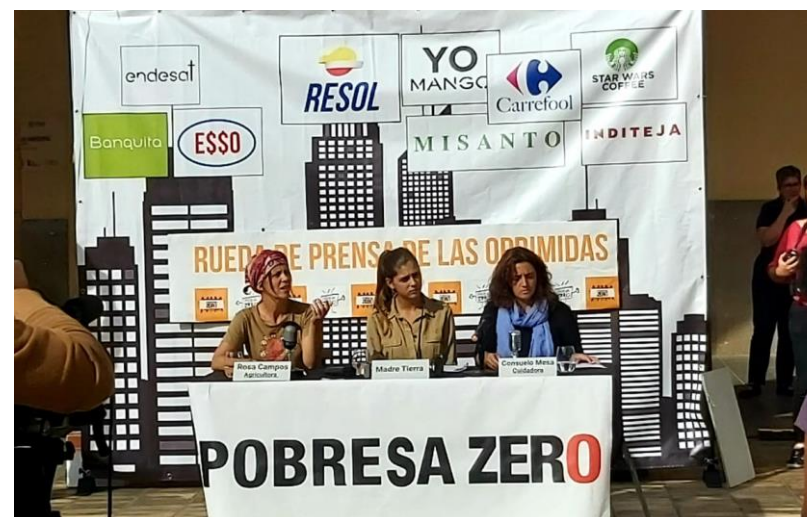
Performance Día de Pobreza Zero. Octubre 2019