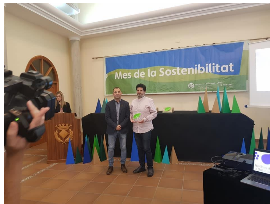
Entrega premio ONG Pankara Mes Sostenibilidad Vila-real. 2019