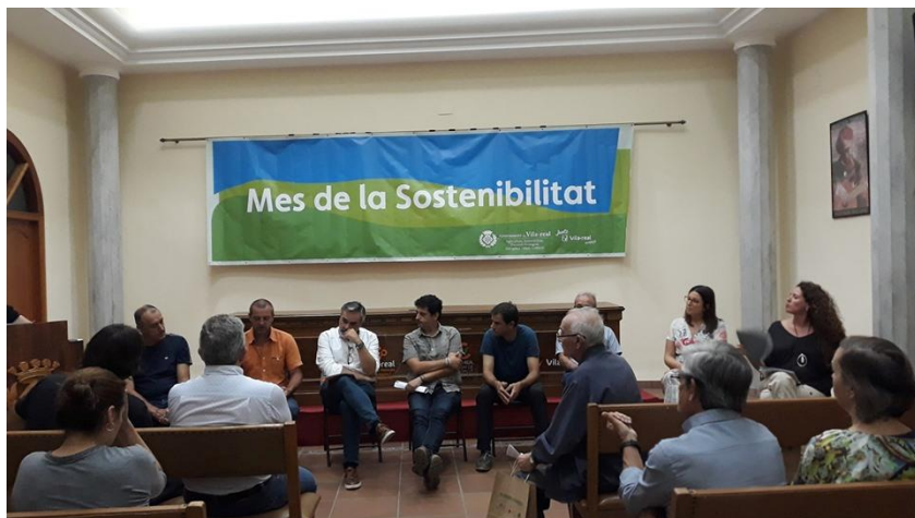
Participación Mesa Redonda Mes Sostenibilidad Vila-real. 2019

Desde la ONG PANKARA participamos en esta mesa de debate, donde el objetivo fue fomentar el diálogo entre las instituciones, empresas, asociaciones y agricultores en torno a las perspectivas, tendencias y nuevas oportunidades del sector ecológico y de Km 0 a Villarreal, así como sus dificultades y soluciones, tanto en la producción como en la comercialización.