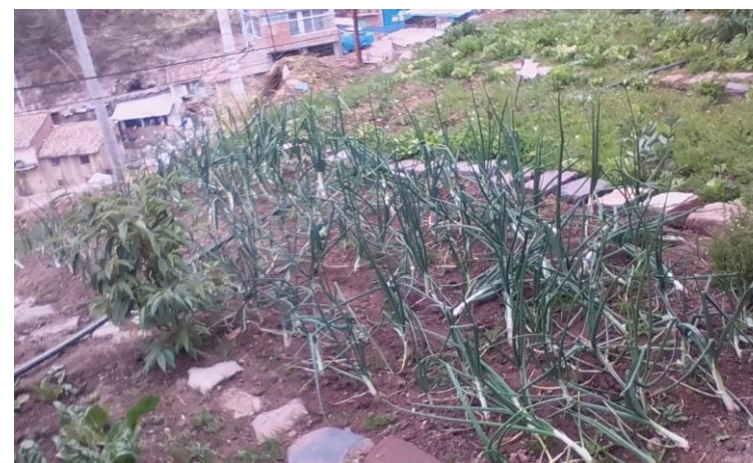
Proyecto Fundación Cristo Vive (Perú)