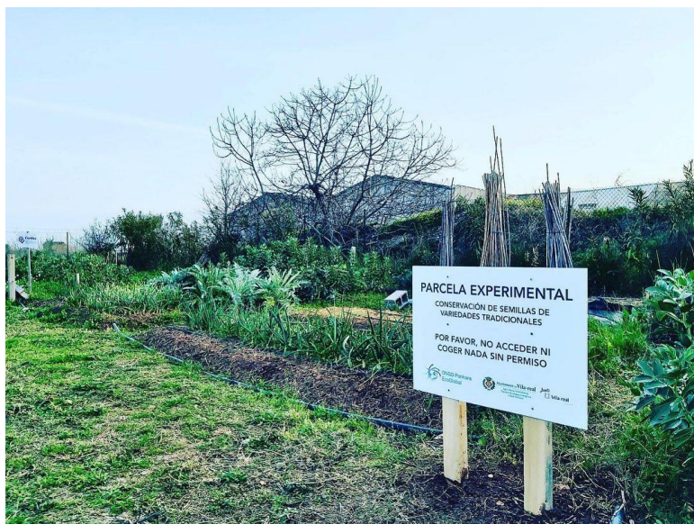
Parcela ONG Pankara en los huertos urbanos de Vila-real

Cultivo de hortalizas, favoreciendo y recuperando el cultivo de variedades autóctonas y locales. Para ello, desde la Estación Experimental Agraria de Carcaixent nos facilitaron semillas de variedades de hortalizas autóctonas que hemos ido cultivando y guardando nuevas semillas.