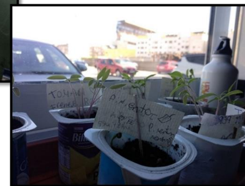
Actividades Colegios e Institutos de Vila-real