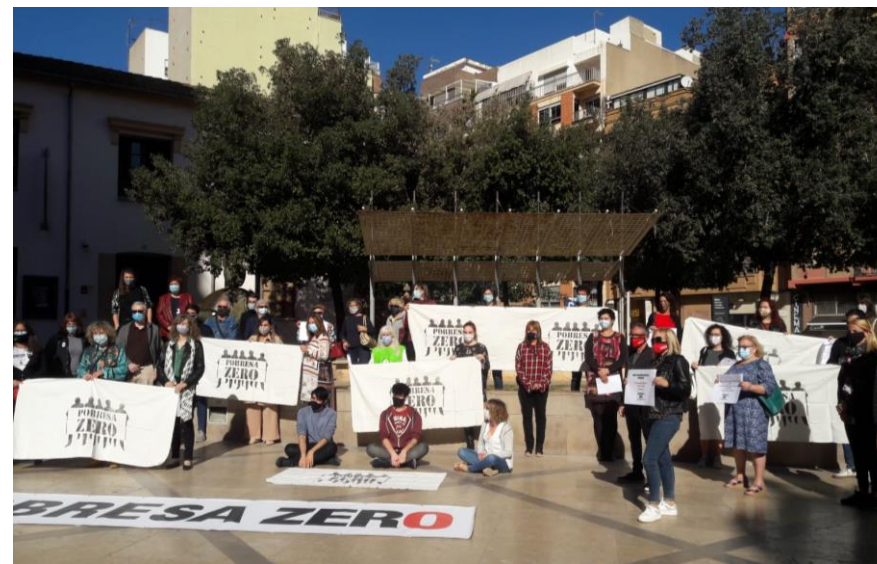
Concentración por el Día de Pobreza Zero. Octubre 2020

Se hizo una concentración para hacer ver a la ciudadanía la importancia del cuidado al planeta y como esto influye en la pobreza en el mundo. A continuación se hizo la lectura de un manifiesto en la Plaza de las Aulas de Castellón.