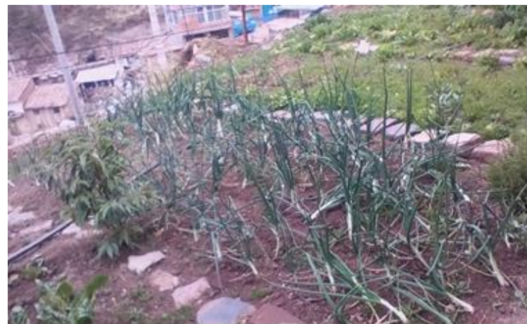
Proyecto Fundación Cristo Vive. Centro Hogar de Acogida Temporal Sonqo Wasi (Perú)