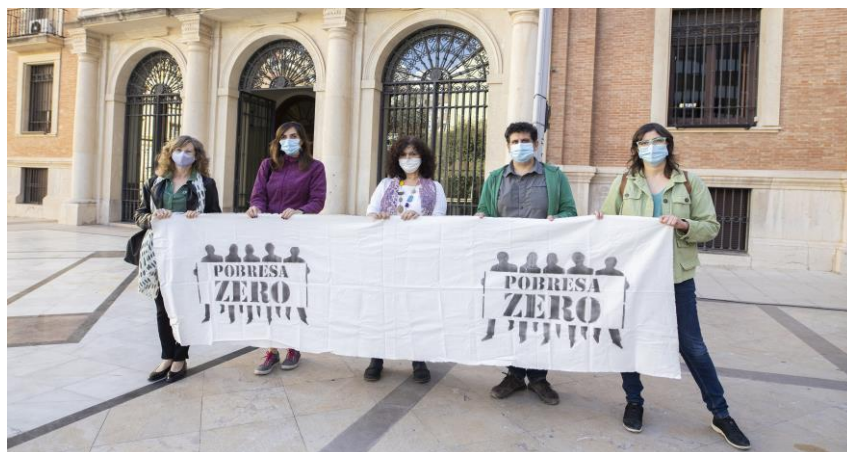
Concentració per el Dia de Pobreza Zero.. Octubre 2020