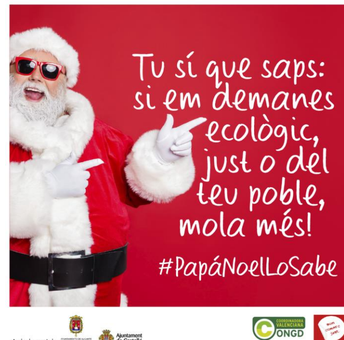
Imagen de la campaña de Navidad “Consumo responsable y Comercio Justo” realizada por la Coordinadora Valenciana de ONGD.