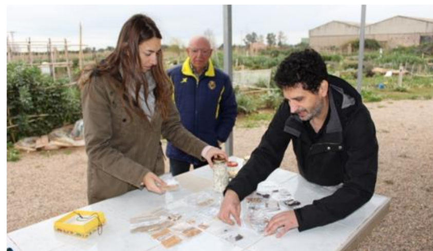
Banco de semillas. ONG Pankara Ecoglobal

Por estos motivos las variedades locales son más rústicas, permiten obtener mayores rendimientos, a la vez que proporcionan un sello de identidad a la agricultura de la zona, por eso es importante utilizarlas en nuestros huertos ecológicos y sostenibles.