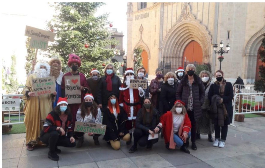
Acción en la Plaza del Ayuntamiento de Castellón. Diciembre 2020

Participación y organización junto a la Coordinadora Valenciana de ONGD de la campaña de Navidad “Consumo responsable y Comercio Justo” en la que se hicieron varias entrevistas en radio y se realizó una acción simbólica en la Plaza Mayor (Castellón). Diciembre 2020.