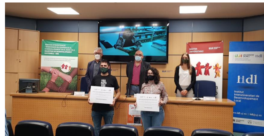
Entrega de premio de investigaci3n de TFM- MCAD/UJI. Noviembre 2020

Participaci3n como representante de la CVONGD en la clausura y entrega de premio de investigaci3n de TFM en la jornada organizada por el M3ster de Cooperaci3n al Desarrollo de la Universitat Jaume I junto con el Ayuntamiento de Castell3, en la Jornada de Investigaci3n e Intervenci3n en Cooperaci3n al Desarrollo en el marco de los ODS: Intercambio de buenas pr3cticas del M3ster Universitario en Cooperaci3n al Desarrollo de la Universitat Jaume I que se celebr3 en noviembre de 2020.