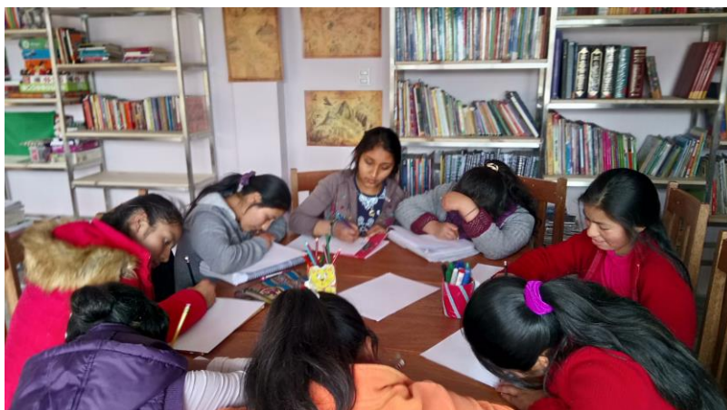
Proyecto Asociación Qallariy, Proyectos para la ayuda al desarrollo Casa Mantay (Perú)