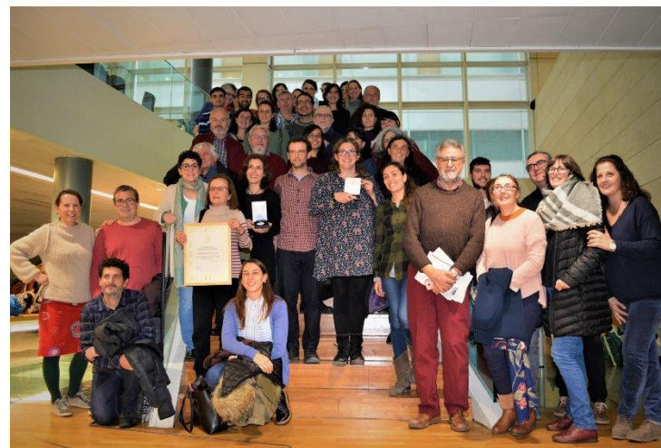
Junta ordinaria CVONG 2018